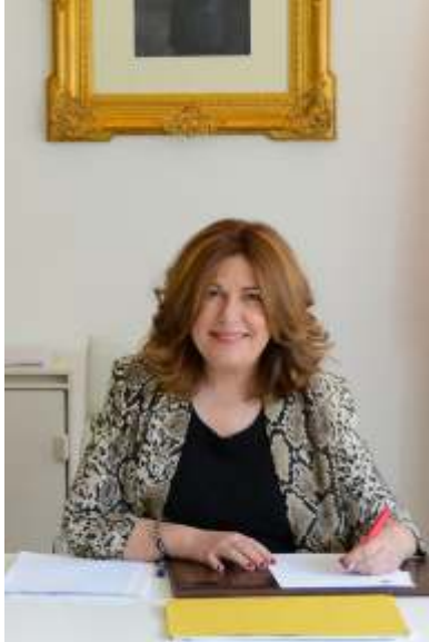
Natalia de Andrés Alcaldesa de Alcorcón

El desarrollo del ser humano pasa ineludiblemente por incorporar la cultura como una pieza esencial e imprescindible en nuestra vida diaria. Todo ello cobra más importancia aún durante en las edades más tempranas, ya que incentivar la pasión por las artes, el teatro, la danza... permitirá incentivar el desarrollo de una sociedad con sensibilidad, formada y cohesionada.